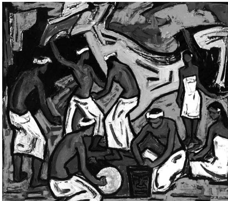
Nuostabusis prezidento Valdo Adamkaus galerijai Svėdasuose dovanojamas paveikslas „Tamurė“ (Meilės šokis).

je nuolat vyksta parodos, galerija yra sukaupusi ir nemenką dailės darbų kolekciją. Svėdasiškiečiai buvo net sumanę pastatyti dailininkui J. Rimšai paminklą, bet galiausiai nusprendė išigyti nors vieną jo paveikslą, juk J. Rimšą prieš pat mirtį 1978 m. iš Santa Monikos artimiesiems rašė: „Mano sapnuose dar ir dabar skamba Alaušo ežero varpai, mintyse braidžioju Šventosios pakrančių pievom...“ Kreipėsi svėdasiškiečiai į dailininko bičiuliu save vadinantį ir keletą jo paveikslų savo kolekcijoje turintį prezidentą Valdą Adamkų. Susirašinėjimas užtruko, bet pagaliau gerai pasvarstęs V. Adamkus nusprendė padovanoti Svėdasų galerijai vieną geriausių J. Rimšos paveikslų – „Tamurė“. Dėkingi svėdasiškiečiai, priimdami vertingą dovaną, pažadėjo, kad pasaulinio lygio šedevras bus eks-