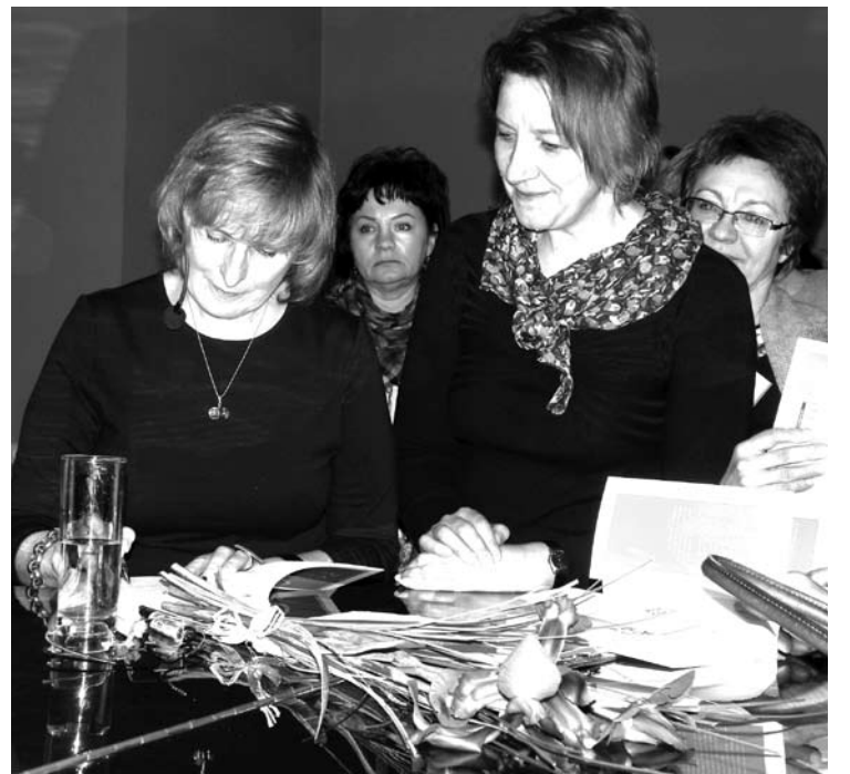
Anykštėnės išpirko visus 40 knygos „Ne bobų vasara“ egzempliorių, kurie buvo atvežti. O po susitikimo išsirikiavo ilga eilė norinčių gauti autografą.

Vienas iš labai moteriškų naujosios knygos skyrių yra skirtas menopauzei. Nors autorė liepė vyrams išeit parūkyt, salėje liko visi trys. „Kai Žemaitė gyveno vidutinis amžius buvo 47 metai. Kitaip sakant, paauginai vaikus ir – „jablynkšt“, jokios menopauzės, dabar gi moters gyvenimo trukmė 78 metai. Pažįstu moterų, kurios išėjo iš televizijos, nes jas bet kuriu metu galėjo išmušti raudonis, prasidėti prakaitavimas“, – kalbėjo R. Vanagaitė ir siūlė moterims pagalvoti apie hormonų terapiją. „Sako, kad dėl to padidėja vėžio rizika, bet aš neaukosiu nė vieno gyvenimo malonumui dėl papildomų 5 metų senelių namuose“, – sakė autorė. Štai kaip ji knygoje reziumuoja šios moteriškos problemos sprendimą: „Pradėsiu iš toli, nuo 1990 metų. Filmuoti Lietuvos dainuojančios revoliucijos atvyko Suomijos televizijos grupė. Tuomet vertėjavau jiems. Laidos režisierė – penkiasdešimt penkerių žavinga ir įdomi moteris. Labai susidraugavome. Kai filmavimo grupės moterys buvo kartu duše,